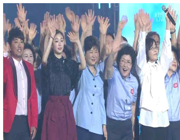
<KBS 주관 '나는 대한민국'>