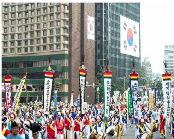
<국민화합대축제 '길놀이' 퍼레이드>