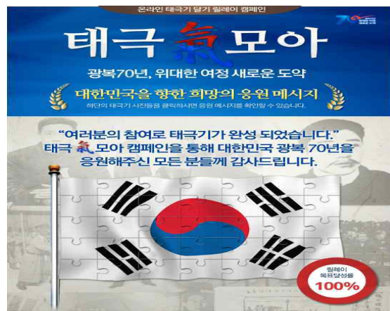
<태극기 모아 캠페인>