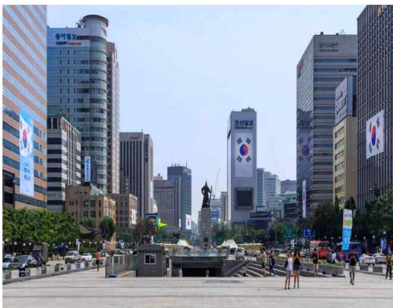
<광화문광장 대형 태극기>