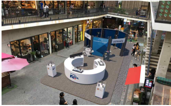
(오프라인 피규어 제작)