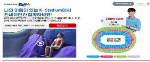
(온라인 피규어 응모 및 제작)