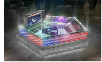
(피규어 상상스타디움 배치)