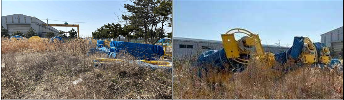
해상풍력 실증사업 사례 : 제작후 방치중인 R&D 관련 장비