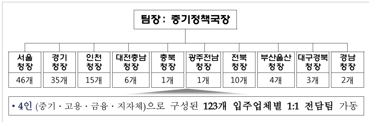
<「개성공단 기업전담지원팀」 체계도 >