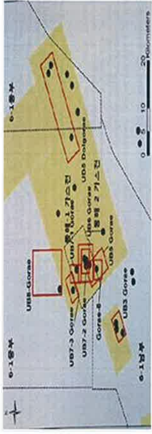
[그림 5] 해수부 도출 CO 2 저장 유망구조도

주: 1. □ : 해수부가 도출한 국내 CO 2 저장 가능 후보지 2. ● : 조광권자 등이 해저광물을 탐사채취하기 위해 설치한 시추공