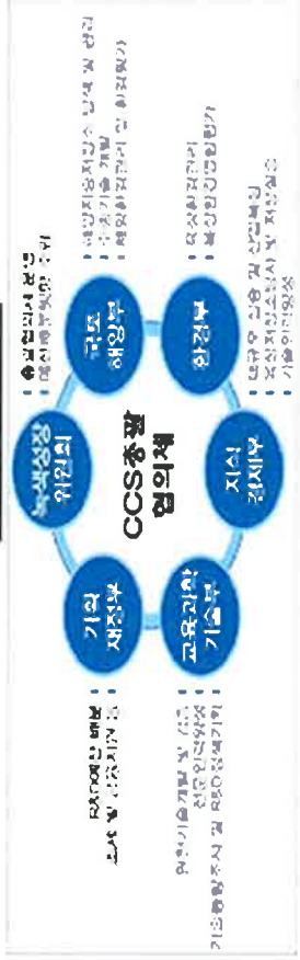
[그림 3] CCS 사업추진 체계도

CCS 추진계획에 따르면 주요정책 결정 및 총괄·조정 기능을 수행하기 위해 [그림 3]과 같이 관계부처 및 전문가 중심으로 ‘CCS 총괄협의체’를 구성·운영하도록 되어 있다.